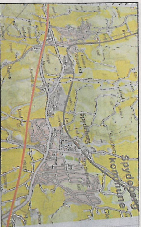
SØK FOR SPYDEBERG: Traseen er tegnet søk for Spydeberg, med en mulig stasjon i grenseområdet mellom Hobøl og Knapstad.

■ Deutsche Bahn er hyret inn som uavhengig utreder av lynntog i Norge, samtidig med at Jernbaneverket har den offisielle utredningen på oppdrag fra Stortinget.