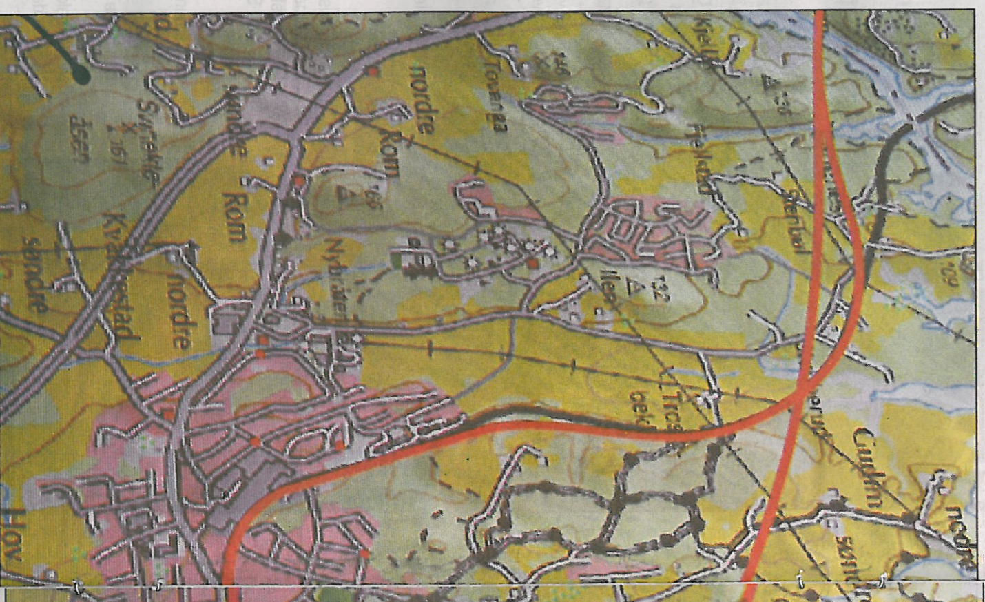
DELT TRASE: Gjennom Askim er det tegnet en delt trasé, der togene som skal st

trond-eivind.nilsen@smalene.no 915 12 078